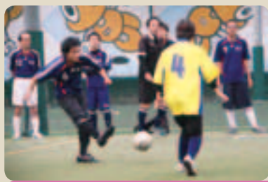
エポック社 × 石川玩具

エポック社対石川玩具は、無失点でエポック社が勝利。大会始まって以来、初の3位となりました。石川玩具は、平成19年度の4位以来、4年ぶりの4位となりました。